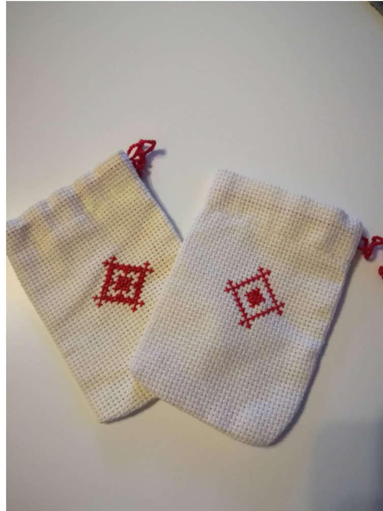
vrećica za lavandu - ukrašena vezom cijena: 15 kn