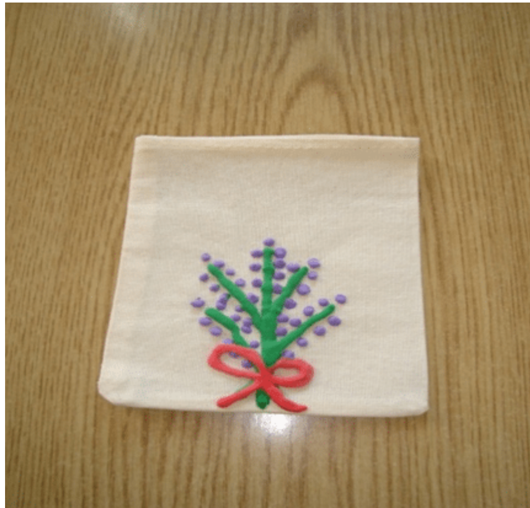
vrećica za lavandu - oslikana cijena: 15 kn

vrećica za lavandu s vezanim tradicionalnim vezom ili oslikana s motivnom lavande