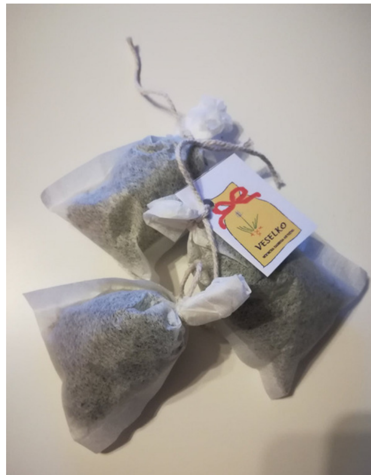
Čaj od matičnjaka Cijena: 5,00 kn