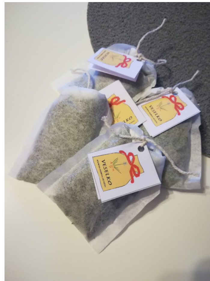
Čaj od kadulje Cijena: 5,00 kn