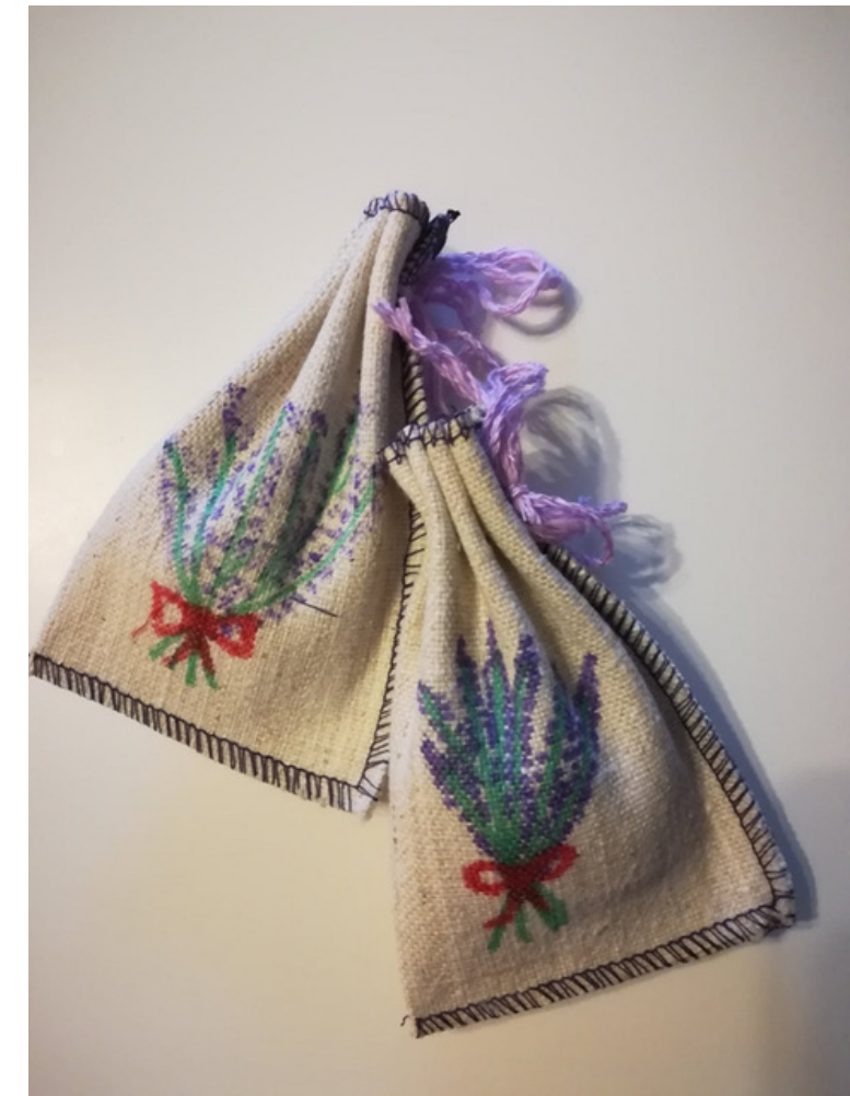
vrećica za lavandu - oslikana cijena: 15 kn