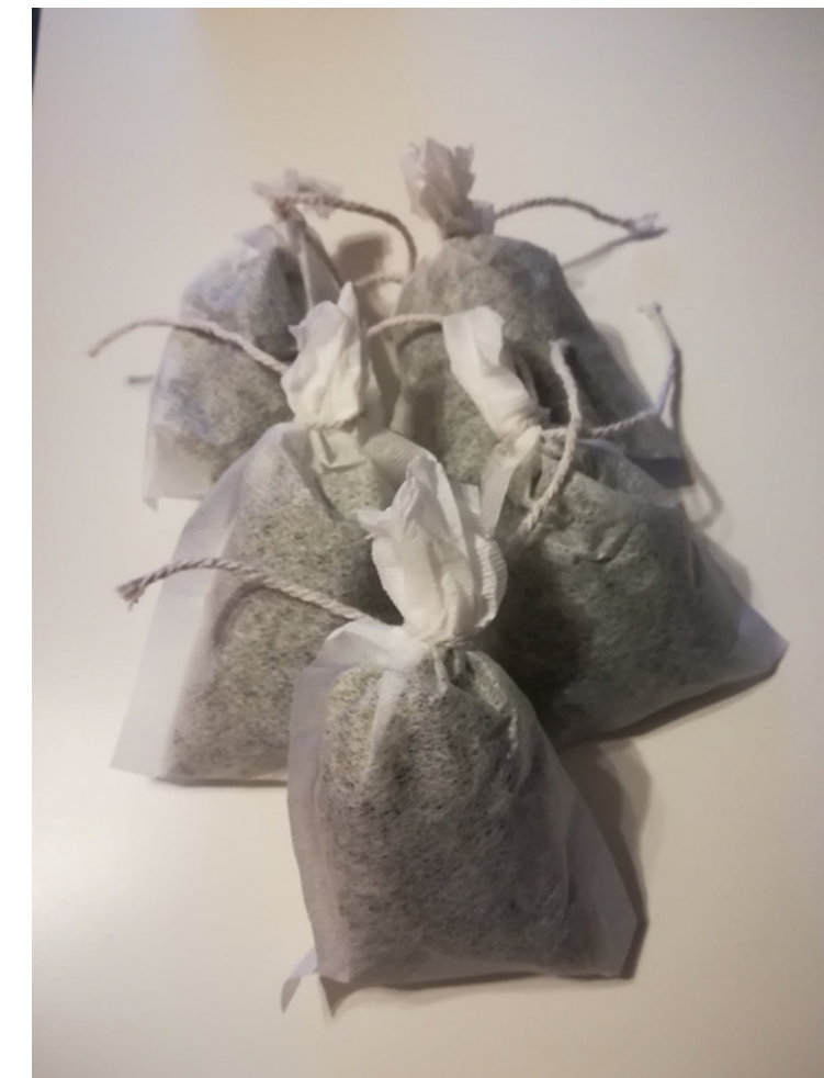
Čaj od mente Cijena: 5,00 kn